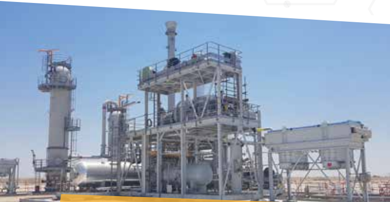
Frame support | Chassis de support