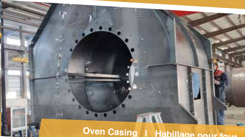
Oven Casing | Habillage pour four