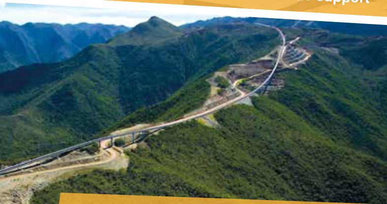
Belt conveyor | Convoyeur à bande