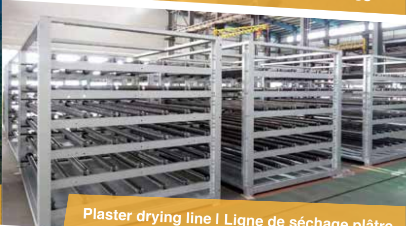
Plaster drying line | Ligne de séchage plâtre