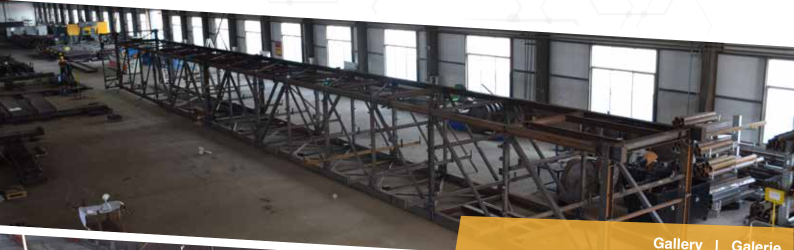
Gallery | Galerie