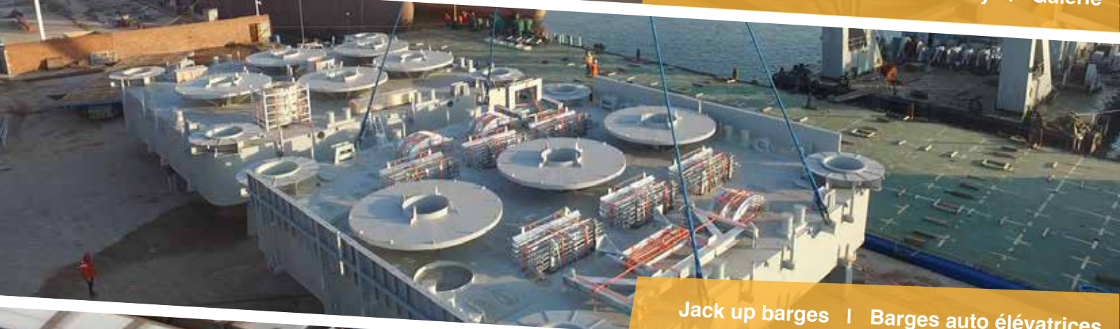
Jack up barges | Barges auto élévatrices