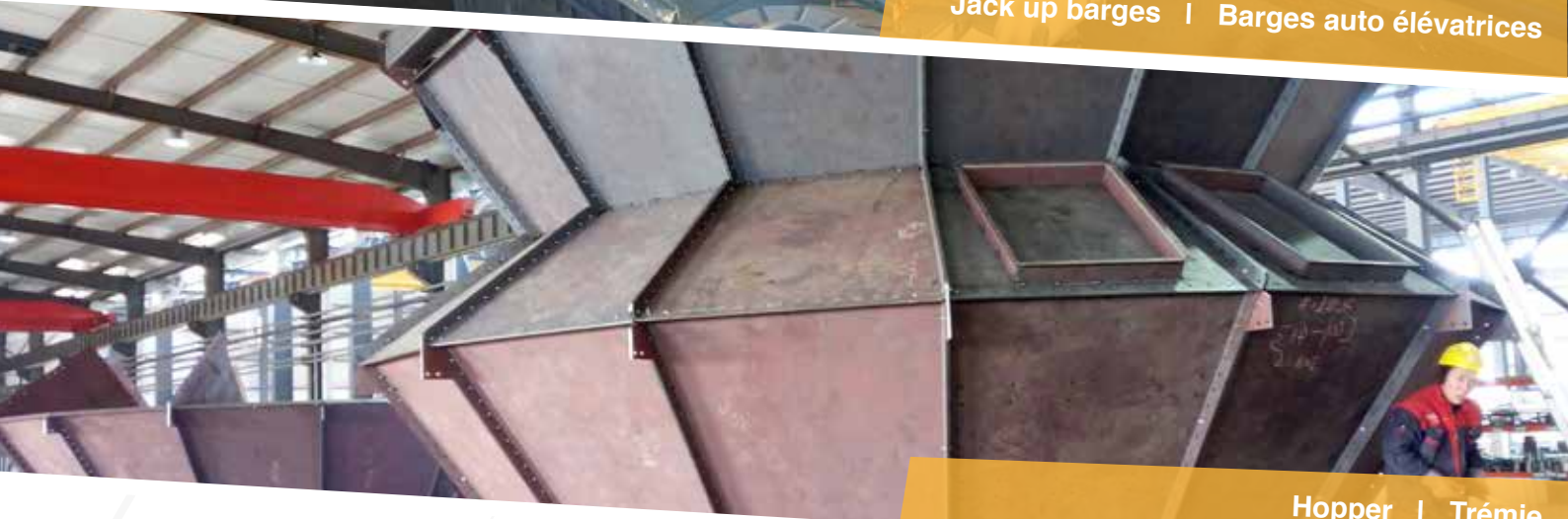
Hopper | Trémie